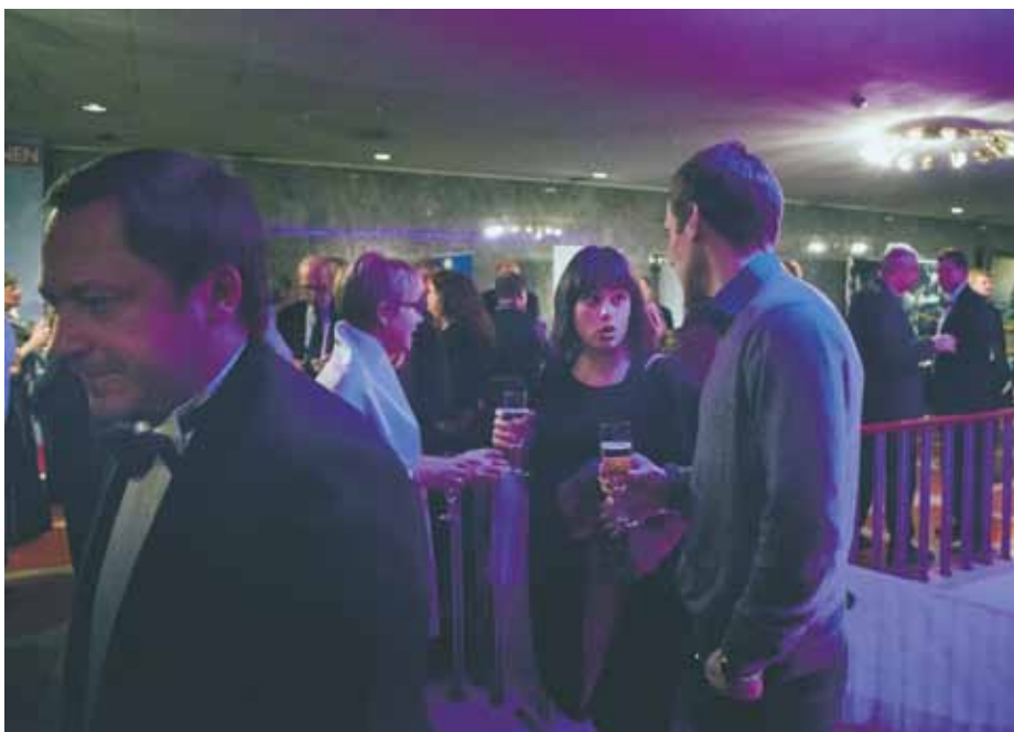
Mingel. Middagen föregicks av mingel och ett glas av den alkoholfria sorten.