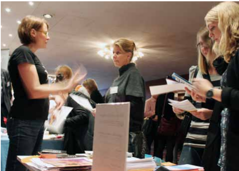
Kontaktskapande. Mellan föreläsningarna gavs möjlighet att knyta nya kontakter.