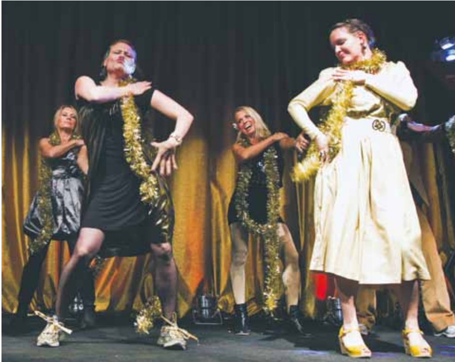
Wednesday Night Fever. När gänget från CAN bjöd på show var det nästan så att självaste John Travolta kunde ha fått prestationsångest. Men bara nästan.