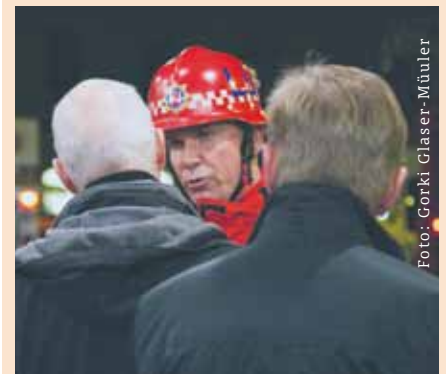
Ett branddrama störde galakvällen på Draken.

Den slutgiltiga utvärderingen är klar någon gång efter jul och analysen är förhoppningsvis klar innan sommaren.